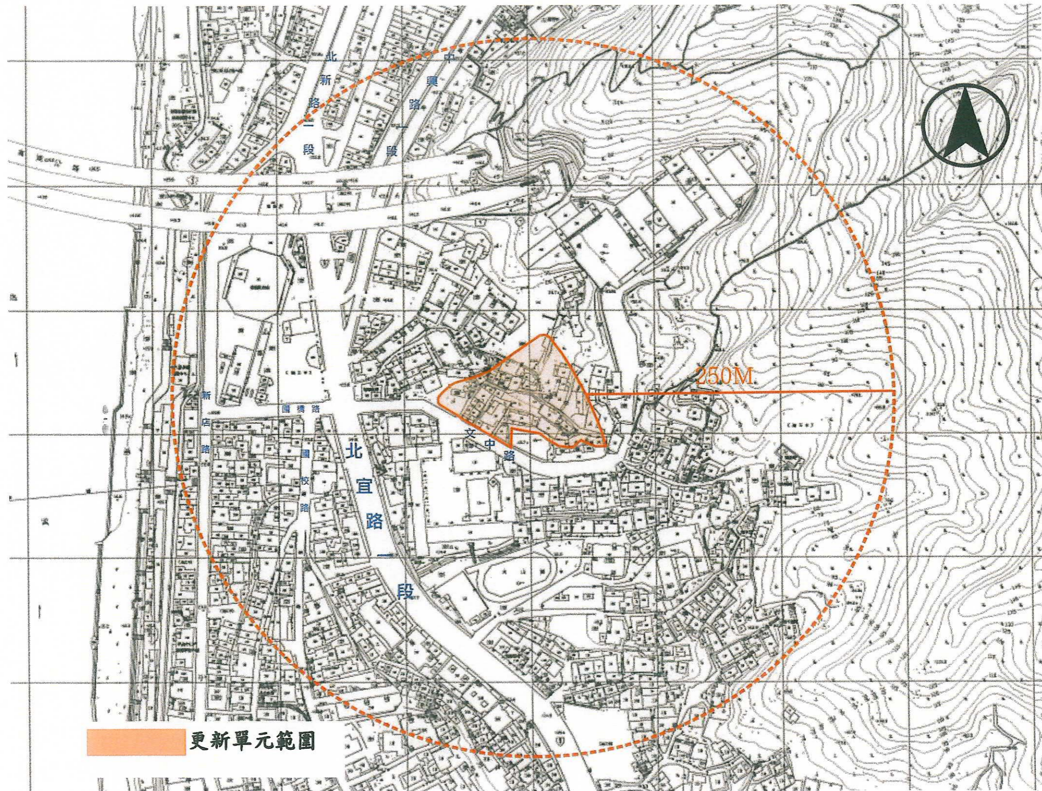
圖 2-1 更新單元位置示意圖 (S:1/3000)